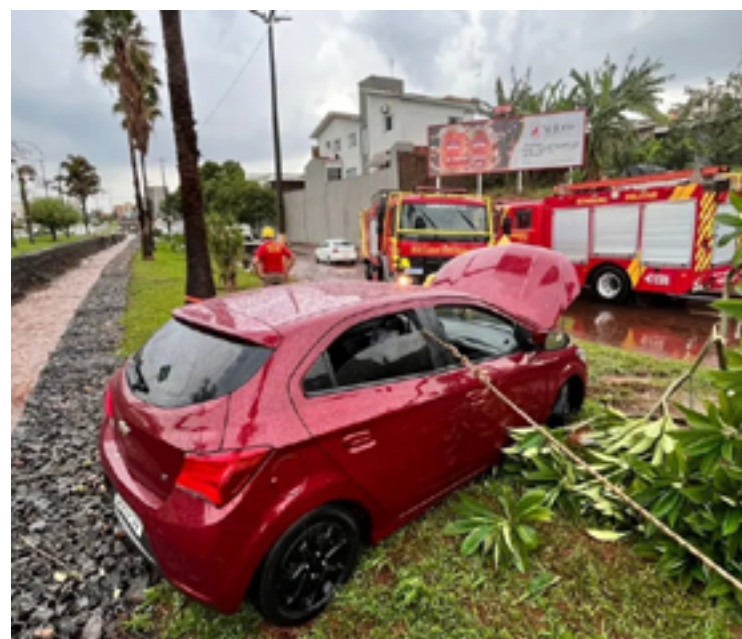
Agentes do Corpo de Bombeiros evitaram que carro fosse levado pela enxurrada na Alameda Barrinha

Em um período de 20 minutos, o volume de chuva chegou a 18 milímetros na região, junto com rajada de ventos de 51 quilômetros por hora.