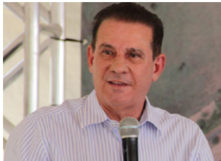
Marconi Perillo: comando do PSDB nacional