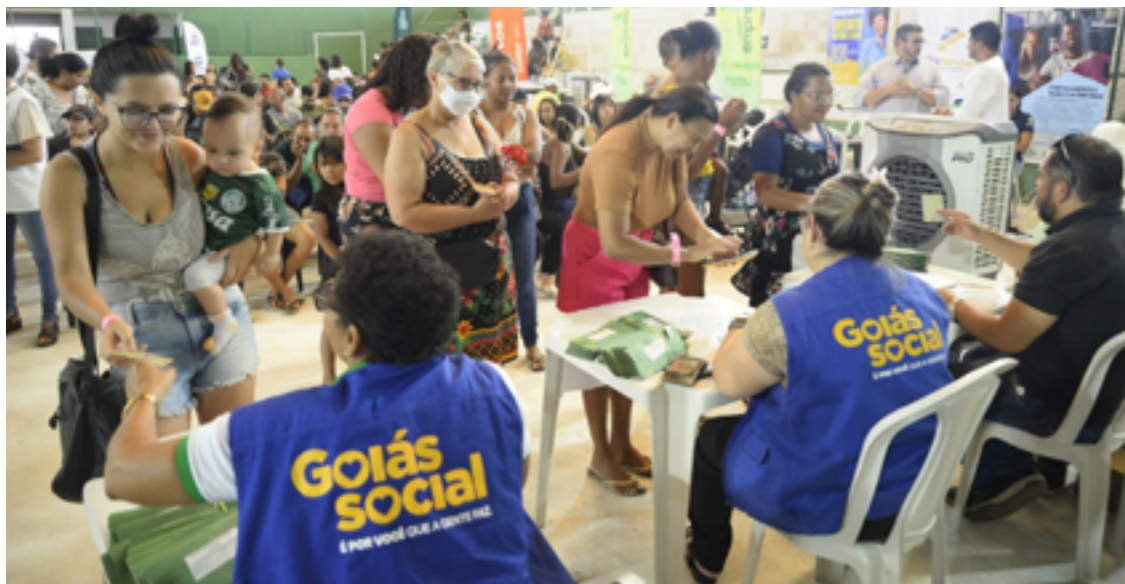
População de Acreúna terá acesso a vários serviços do Goiás Social, além das entregas dos cartões do Mães de Goiás e Dignidade — Foto: Reprodução.

Outros serviços serão oferecidos por várias secretarias de Estado. São elas: Esporte e Lazer (Seel), Indústria, Comércio e Serviços (SIC), Saúde (SES), Administração (com o Vapt-Vupt), Segurança Pública (SSP)/Polícia Civil, Retomada, OVG, Agehab, Emater e Defensoria Pública.