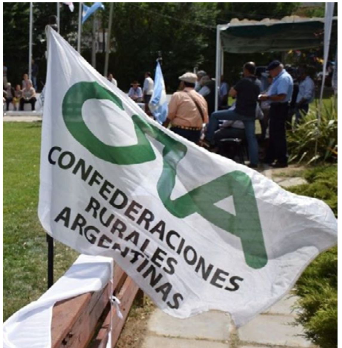
Confederação Rural Argentina espera a redução e eliminação dos impostos e limites sobre as exportações no novo governo

Durante a campanha eleitoral, Milei prometeu a dolarização da economia, a redução gradativa e fim das retenções em até dois anos, a remoção de cotas e tarifas no comércio internacional, eliminação das tarifas de importação de insumos e revogação da lei de terras permitindo compra por estrangeiros.