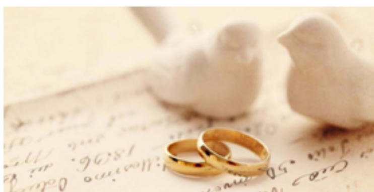
Os interessados em participar do Casamento Comunitário devem acessar o site da prefeitura e identificar através do edital, se estão aptos a se inscreverem — Foto: Reprodução — Foto: Reprodução.

Os casais que forem contemplados, vão participar de dois encontros com os seguintes objetivos: Esclarecimento sobre o casamento e Ensaio geral da cerimônia do Casamento Comunitário.