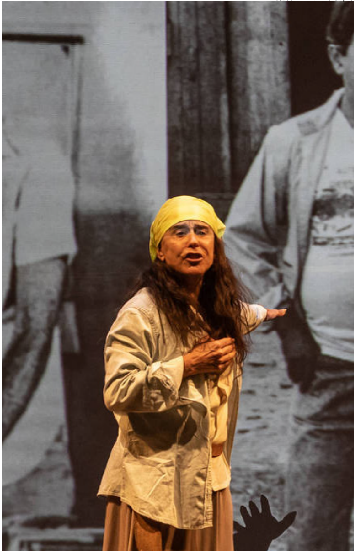
Memória: Lucélia Santos problematiza destruição de floresta tropical

"Voltam a agir. Sua ação só encontra um grande obstáculo pela frente: a consciência ecológica e a disposição de