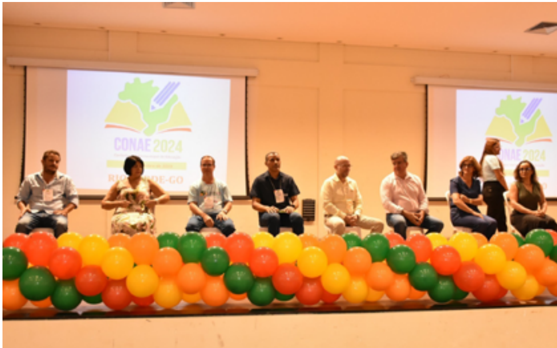
Conferência de Educação: Autoridades presentes em Rio Verde; meta é contribuir para a elaboração do novo PNE 2024-2034

Plano Nacional de Educação (PNE) tem a missão de trazer metas relacionadas à redução das desigualdades, a valorização das diversidades e a emergência ambiental. Etapa nacional acontece em janeiro de 2024