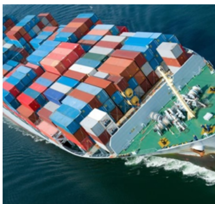
Exportações brasileiras superaram a marca de US$ 300 bilhões. Governo prevê saldo positivo recorde de US$ 93 bilhões para 2023

As previsões estão muito mais otimistas que as do mercado financeiro. O boletim Focus, pesquisa com analistas de mercado divulgada toda semana pelo Banco Central, projeta superávit de US$ 77 bilhões neste ano.