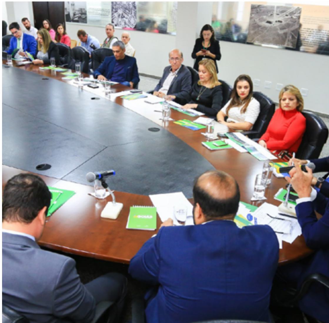
Ronaldo Caiado e membros da Bancada Federal de Goiás: PEC da Reforma Tributária precisa ser alterada

O modelo, na avaliação de Caiado, nivela e engessa as unidades da federação que possuem realidades distintas. “Um exemplo: Goiás cresceu no ano passado 6,6% enquanto o país cresceu 2,9%. Então cada Estado tem a sua característica”,