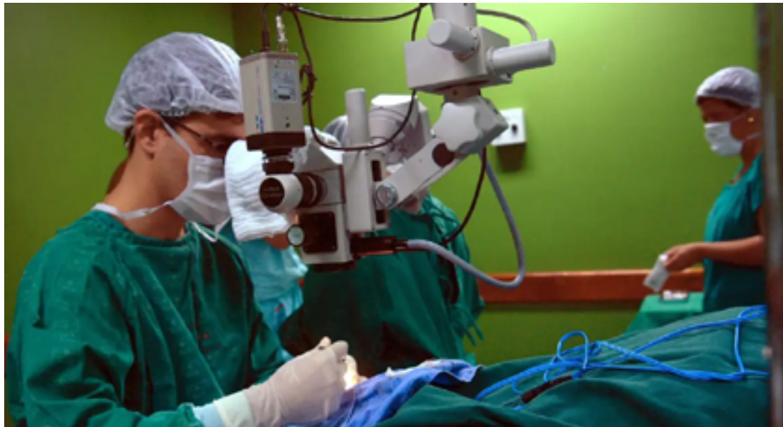
A insuficiência cardíaca, caracterizada por problemas de bombeamento do sangue pelo coração, é a enfermidade que mais mata no mundo

Resultados de experimentos em animais, cultura de célula e tecido cardíaco humano ganham destaque internacional.