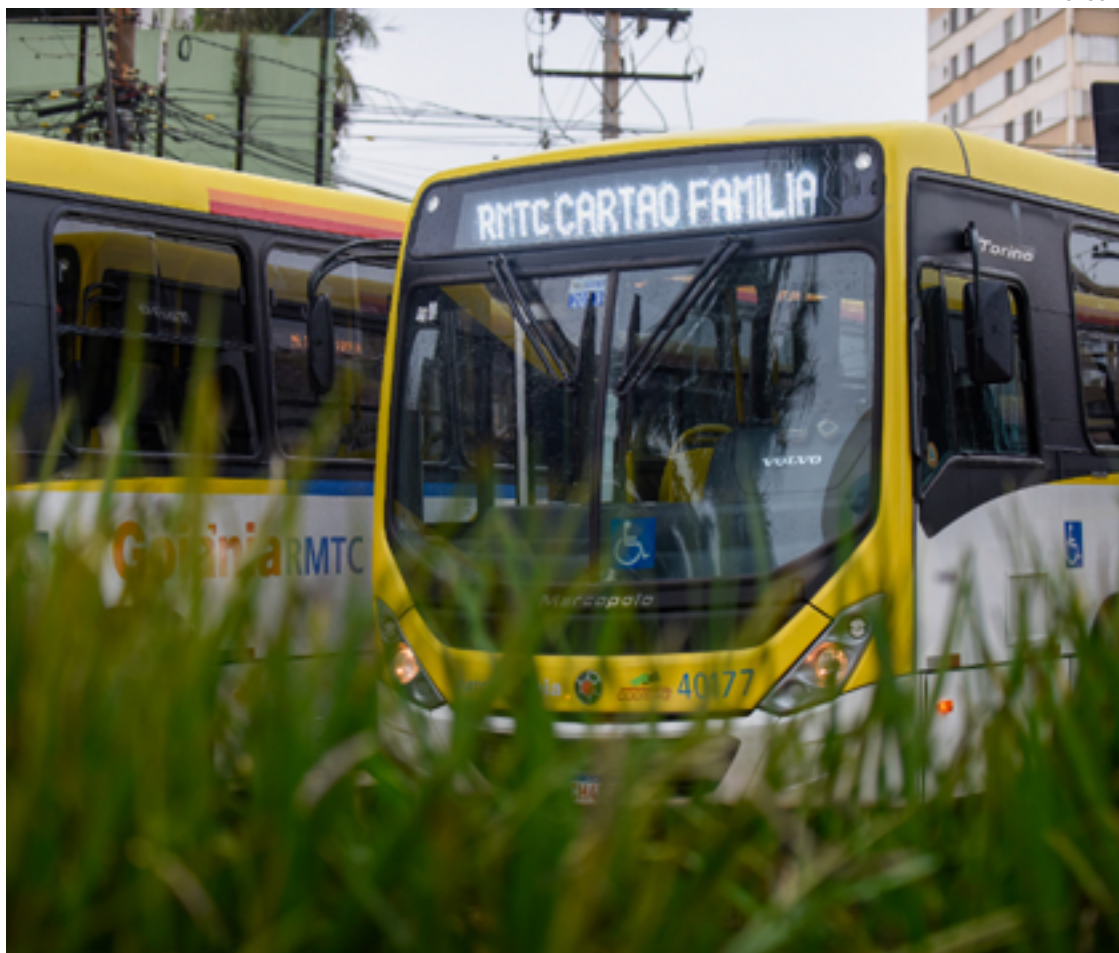
Valor de R$ 4,30 está congelado desde 2019: Estado paga 41,2% do custo da passagem

O governo lista - além do congelamento da passagem - o lançamento de novos formatos de bilhetagem, como o Bilhete Único; o Passe Livre do Trabalhador; cartão Família e a Meia Tarifa. A bilhetagem por meio de cartões de crédito ou débito por aproximação, além do pix, facilitaram a vida de quem utiliza transporte coletivo.