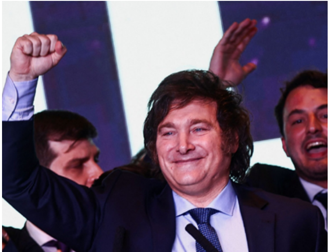
Javier Milei venceu o peronismo com mais de 55% dos votos e derrotou o ministro da economia de Alberto Fernandez, Sérgio Massa

O agronegócio argentino, segundo a Bloomberg, foi um dos grandes apoiadores do liberal na corrida presidencial. Milei prometeu que reduziria os impostos de exportação e também