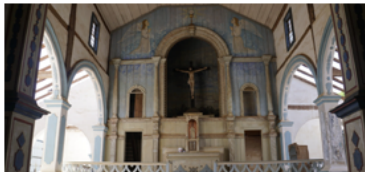
Obra no santuário recebe investimento de R$ 2,2 milhões do Governo de Goiás

A igreja do Nosso Senhor do Bonfim tem arquitetura colonial e foi construída no sistema de gaiolas. Possui altares em estilo neoclássico. Até 1846, eram feitos sepultamentos dentro da igreja. Após essa data, devido à interdição da vigilância sanitária da época, por causa da ocorrência de pestes, a igreja adquiriu um terreno para o cemitério.