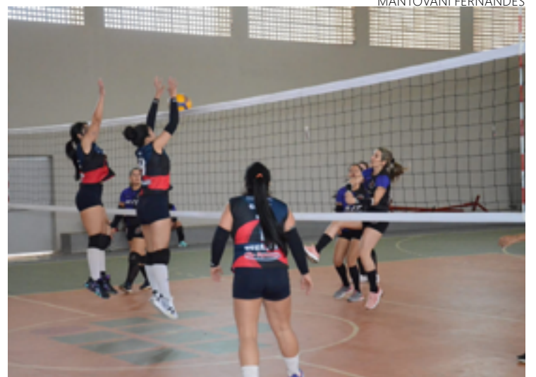
Fase final dos Jogos Abertos de Goiás 2023 será realizada em Goiânia entre os dias 8 e 10 de dezembro