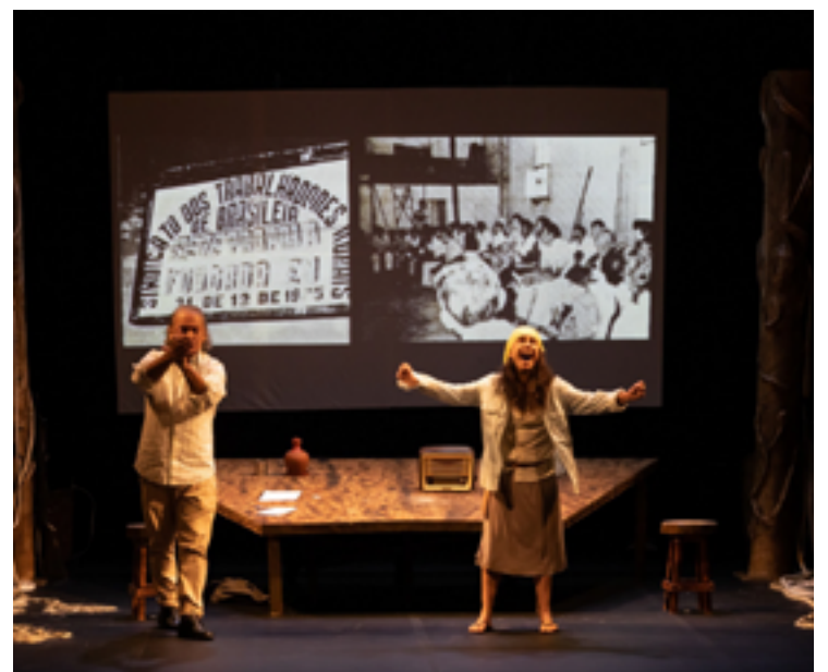
Urgência: artista encontrou motivação para criar espetáculo a partir de descaso ambiental

Teatro Sesc Centro R. 15, 178-298 - St. Centra R$ 45 para público em geral