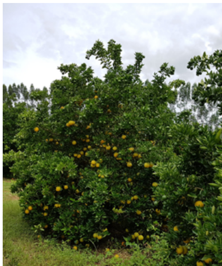
LEVANTAMENTO FITOSSANITÁRIO: monitoramento teve início em outubro e ocorrerá em 43 municípios goianos, com o objetivo de levar orientações a produtores, prevenir, controlar e delimitar pragas